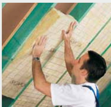
Fig. 3 Klem de isolatie tussen de kepers. Coincez l'isolation entre les chevrons.