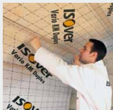
Fig. 4 Breng een lucht/dampscherm aan, zoals Isover vario KM duplex. Appelez un pare-vent/ vapeur, comme l' Isover vario KM duplex.