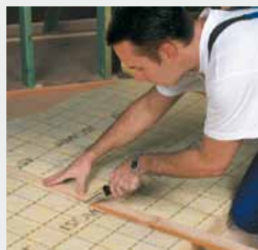
Fig. 2 Snij de gewenste breedte langs de maatstrepen af met een lat en het Isover isolatiemes. A l'aide du couteau Isover coupe laine et d'une latte, coupez à dimension en suivant les prémarquages.