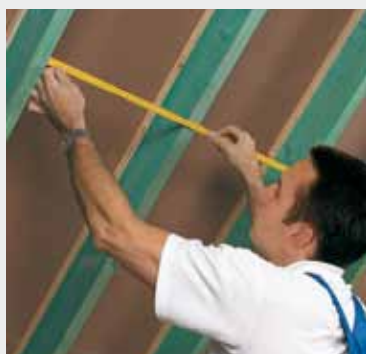
Fig. 1 Meet de ruimte tussen 2 kepers en voeg hier 1 à 2 cm aan toe. Mesurez la distance entre 2 chevrons et ajoutez-y 1 à 2 cm.

L'application d'un pare-vent/vapeur est indispensable pour assurer l'étanchéité à l'air et à la vapeur d'eau (fig.4). Le pare-vapeur à base de polyamide au pouvoir asséchant est décrit dans la fiche Isover vario KM duplex.